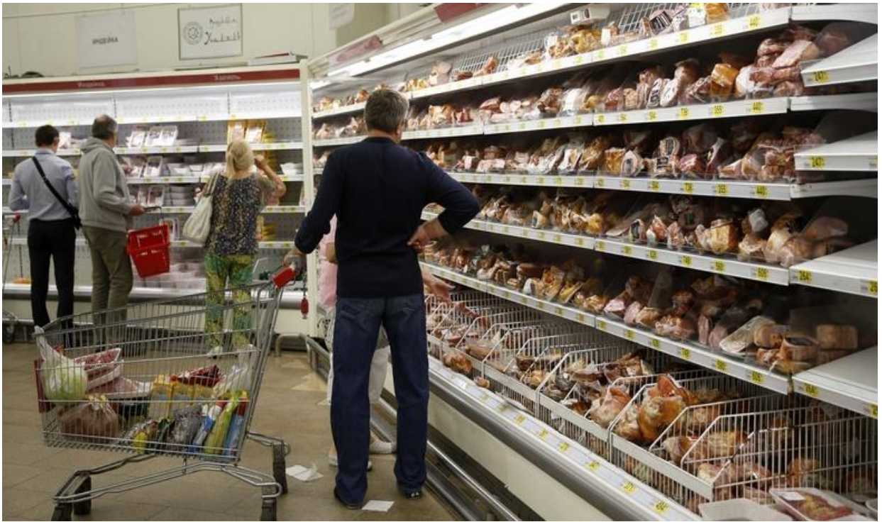
Почти половина украинцев, согласно опросу, экономит на еде и одежде.

Всемирный банк констатировал шокирующую украинскую реальность. Экономический кризис, который начался в 2014 году в Украине, привел к тому, что уровень бедности в стране увеличился на 67%! «Если в 2014 году за чертой бедности жили 15% населения Украины, то сегодня — 25%. В Украине самый большой в Европе запас плодородной земли. Выгодно и ее географическое положение — на перекрестке Европы и Азии. Однако государственная политика в плане развития экономики отстала на 20 лет», — подчеркнули во Всемирном банке. Кроме того, директор по вопросам Украины, Беларуси и Молдовы Сату Кахконен отметила, что в нашу страну было вложено намного больше денег, нежели в другие. «Всего $5,5 млрд, причем половина средств — $2,5 млрд — в различные инвестиционные проекты, плюс $2 млрд — на поддержку региональных бюджетов для проведения реформ, еще $500 млн — на поставку газа. К сожалению, не все эти деньги использованы в полном объеме, и мы ждем решений от правительства Украины», — возмущена Кахконен.