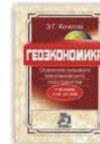
2. Геоэкономика (освоение мирового экономического пространства), Москва, 2011.