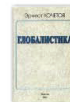
11. Глобалистика как геоэкономика, как реальность, как мироздание, Москва, 2001.