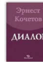
1. Диалог, Москва, 2011.