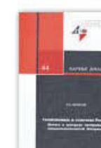
13. Геоэкономика и стратегия России, Москва, 1997.