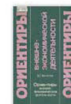
14. Ориентиры внешнеэкономической деятельности. Москва, 1992.