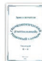
7. Геоэкономический (глобальный) толковый словарь. В 2-х томах, Т.2, Москва, 2002.