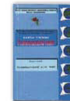
8. Геоэкономический атлас мира, Москва, 2002.