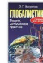
9. Глобалистика: теория, методология, практика, Москва, 2002.