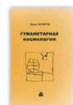
5. Гуманитарная космология, Москва, 2006.