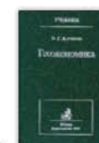
12. Геоэкономика (освоение мирового экономического пространства), Москва, 1999.