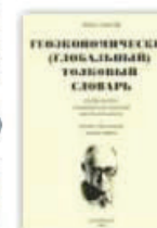
4. Геоэкономический (глобальный) толковый словарь. Екатеринбург, 2006.