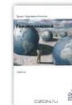
10. Геоэкономика (освоение мирового экономического пространства), Москва, 2002.