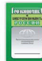
3. Геоэкономика и конкурентоспособность России, Москва, 2010.